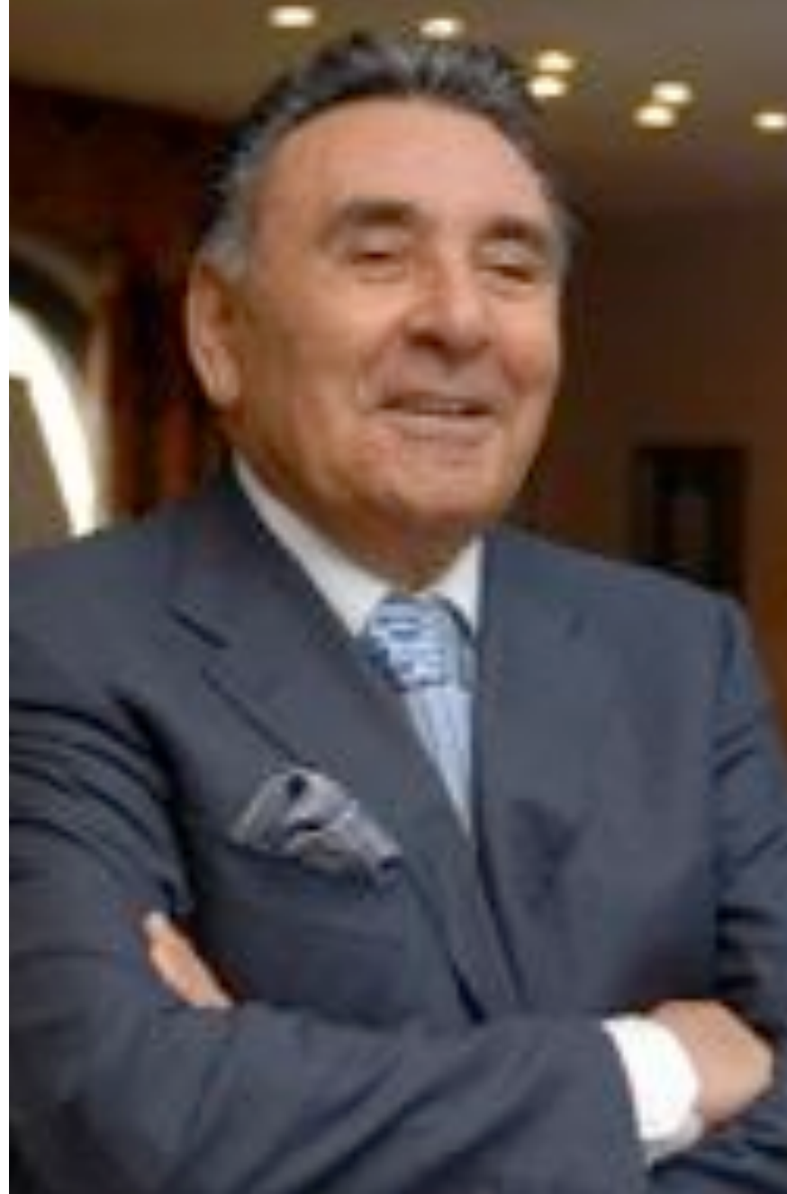
Aydın DOĞAN İcra Kurulu Başkanı